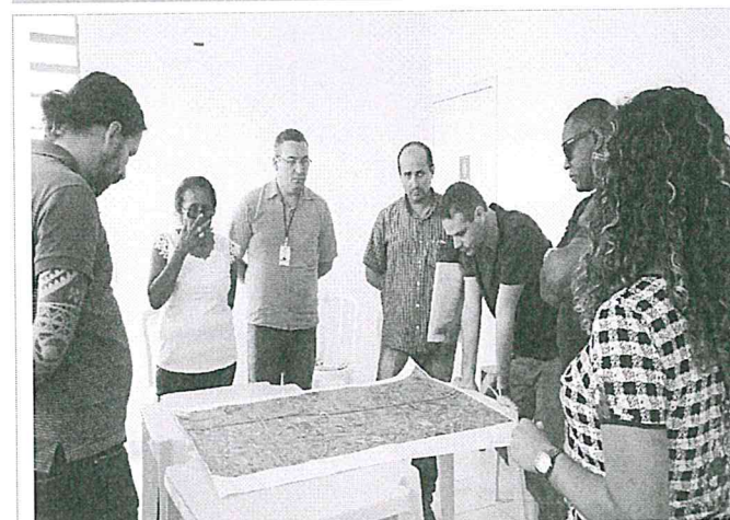
Resgate histórico do território