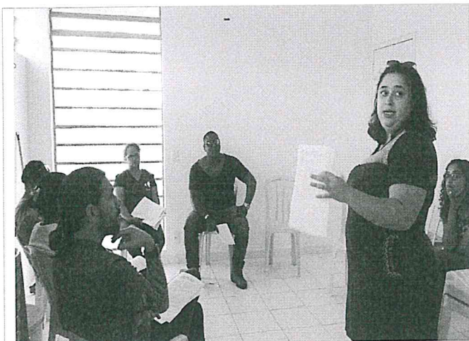
Elaboração do Regimento Interno

Referência: Capacitação do Conselho Gestor