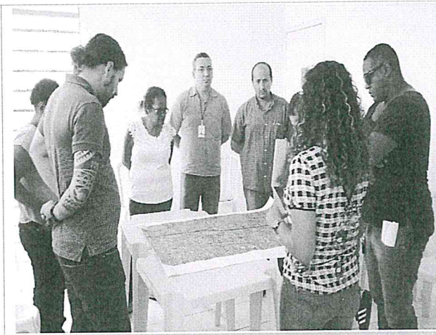
Resgate histórico do território