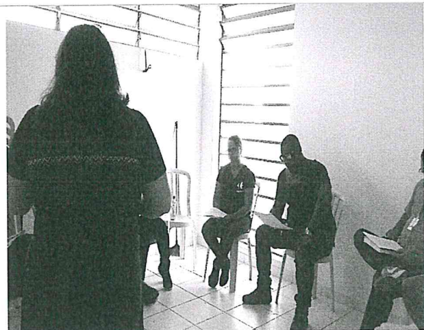
Elaboração do Regimento Interno