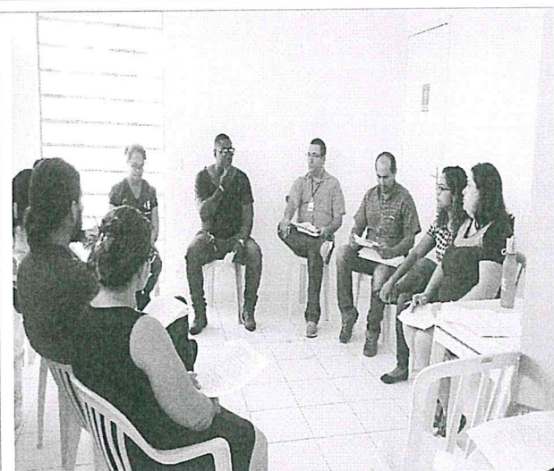
Leitura e aprovação do Regimento Interno