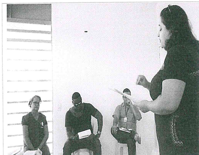
Leitura e aprovação do Regimento Interno